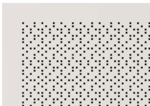
As portas perfuradas absorvem ruídos.

As frentes acústicas dos armários Storage absorvem ruídos perturbadores. O padrão perfurado, além de ser um excelente isolante de ruído é também atraente do ponto de vista visual e está disponível em oito cores.