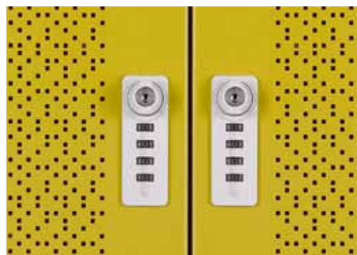
Permite guardar seus materiais de trabalho seguramente.