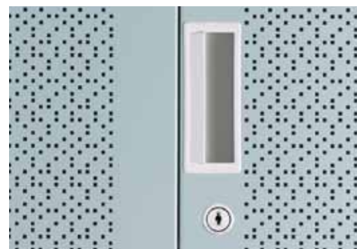
As alças ergonômicas estão disponíveis nas cores branca ou cinza.