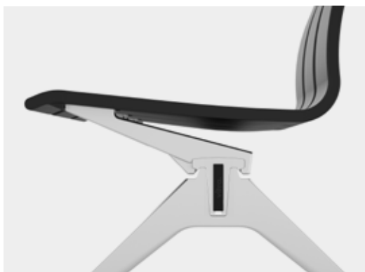
A construção em balanço proporciona um conforto excepcional.