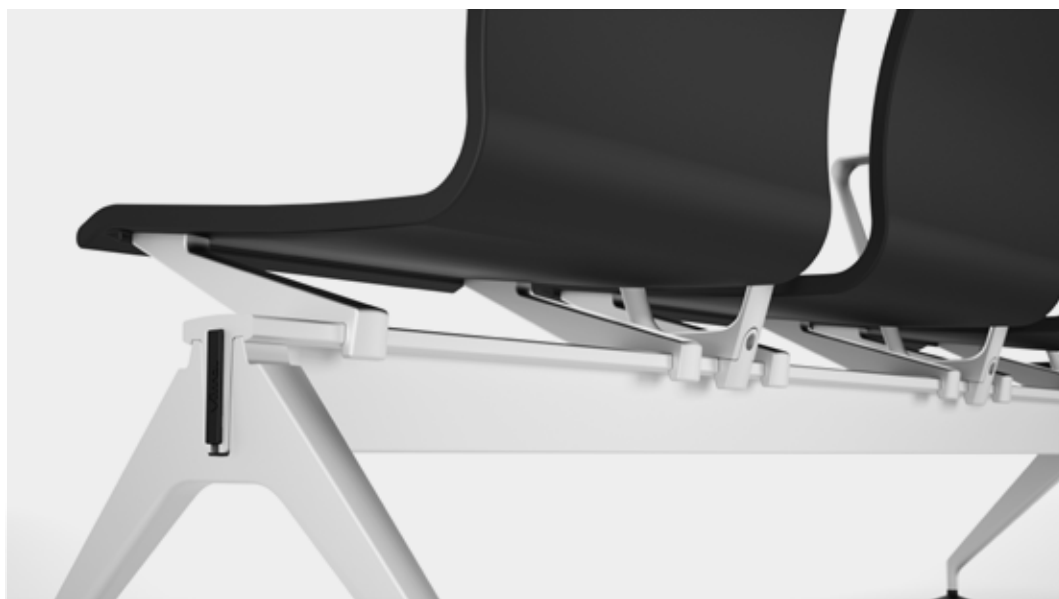
A construção modular e estrutura inteligente requerem poucas pernas para sustentação.