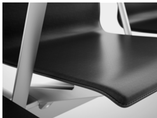
O acabamento opcional em couro é extremamente robusto.