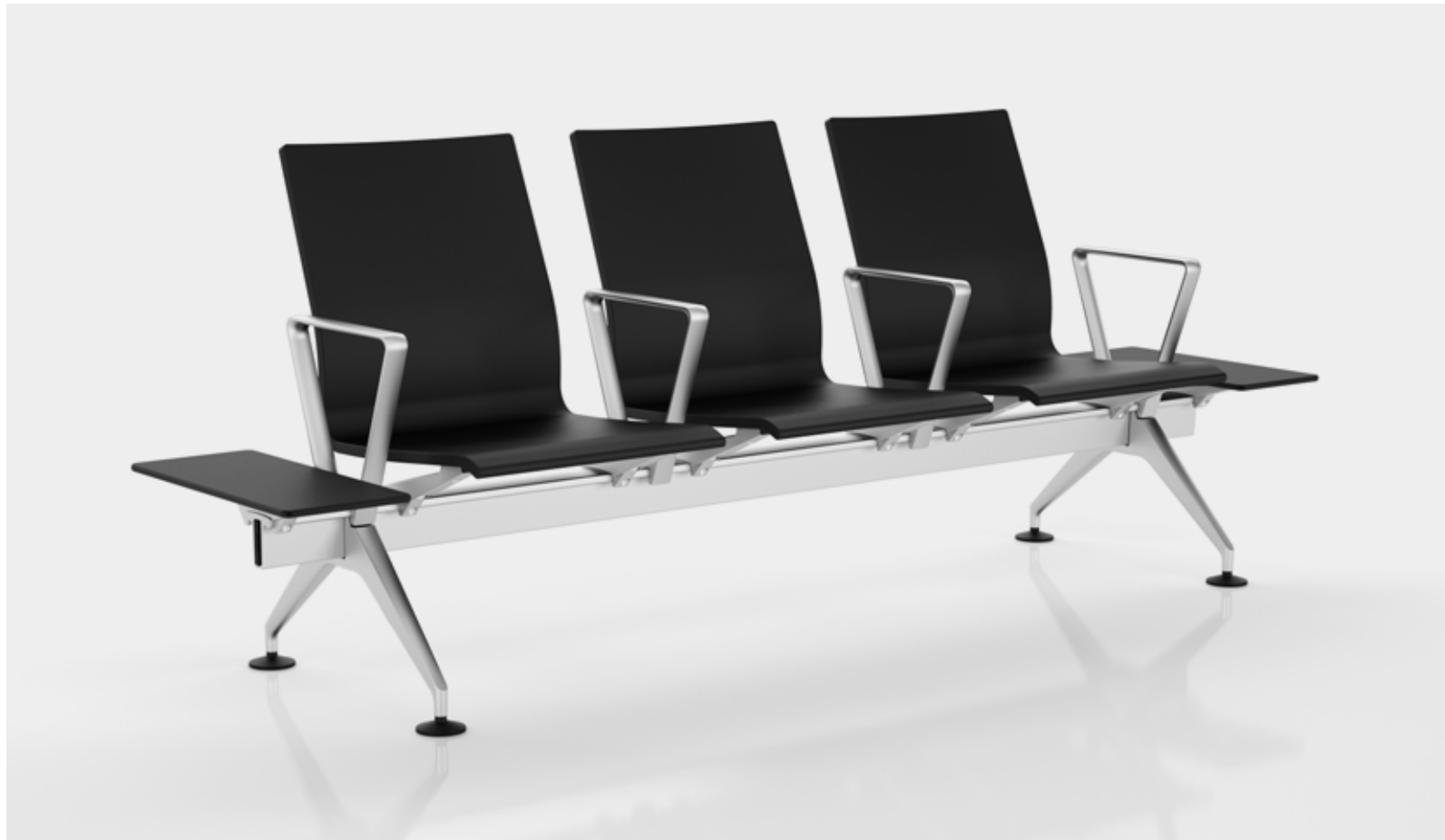
Meda Gate é discreta, funcional e confortável.

Ideal para todos os tipos de áreas de espera: aeroportos, estações de trem, hospitais, shopping centers, salas de espera de escritórios e espaços similares.