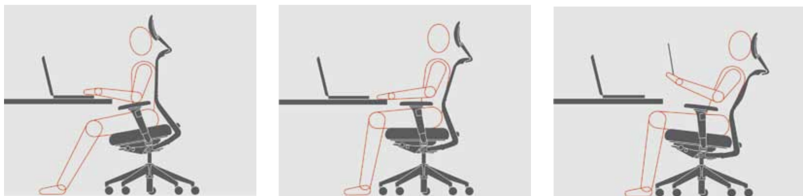
O Instituto de Biomecânica na ETH em Zurique utilizou tecnologia de ressonância magnética e medições EMG para comprovar que o uso do mecanismo de sincronização "Flow Motion" leva ao aumento da atividade muscular em todos os segmentos da coluna lombar proporcionando bem-estar ao usuário.