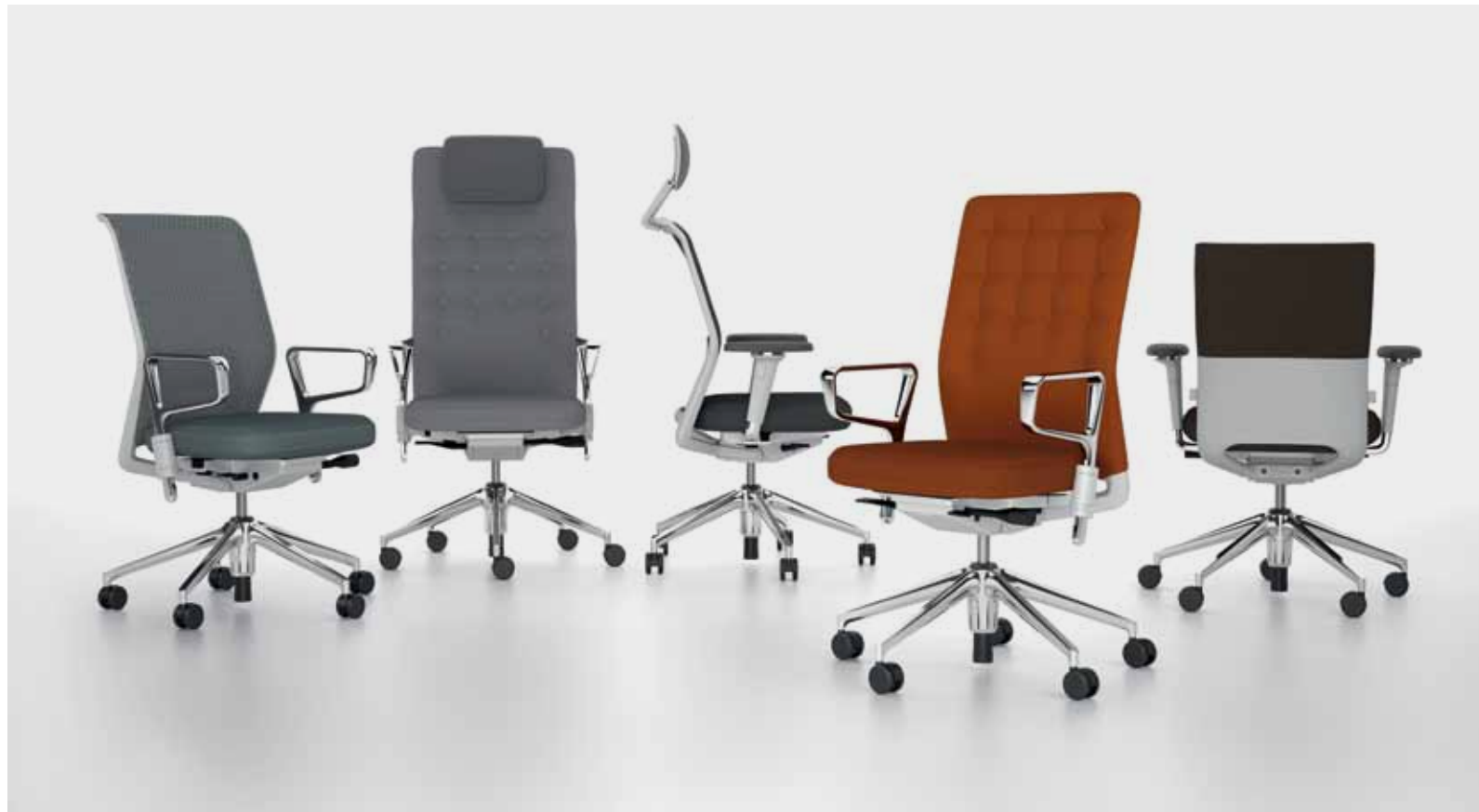
As cadeiras ID Chair podem ser configuradas de diversas maneiras a partir de uma mesma base.

Antonio Citterio e Vitra aplicaram mais de 25 anos de experiência no desenvolvimento deste novo conceito de cadeiras de escritório chamado ID Chair. A cadeira possui design sutil e elegante em tons claros. Oferece aos usuários inúmeras possibilidades de adaptá-la às necessidades individuais em termos de conforto, funcionalidade e estética. Todas as versões do projeto são baseadas em um mesmo conceito técnico e estético. A partir da mesma estrutura, a ID Chair oferece diferentes opções de encosto, braços e base. Além da funcionalidade, ela apresenta um impacto positivo no ambiente de trabalho.